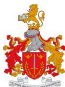
Ilustração 10 A estreita articulação do ICPOL/ISCPSI com a CEPOL tem sido um dos expoentes da cooperação internacional, mormente no que toca à disseminação de produtos científicos.

Ilustração 9 Protocolo entre o ISCPSI e a Faculdade de Psicologia e Ciências da Educação, da Universidade de Coimbra.