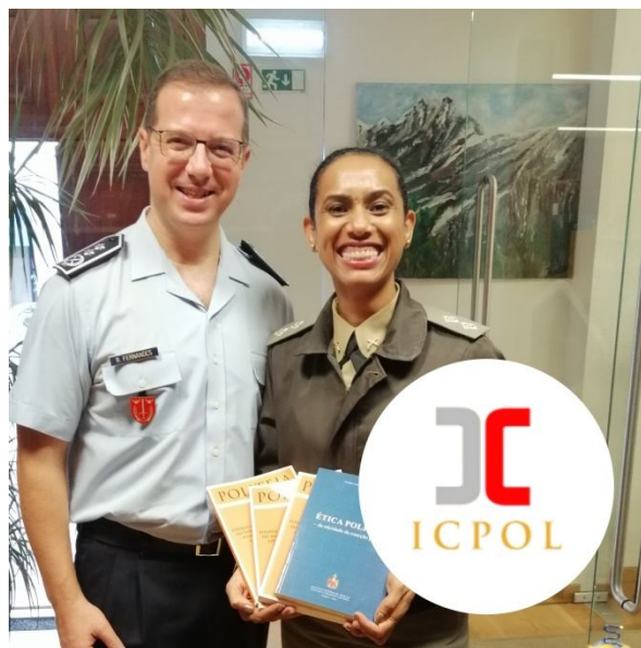
Ilustração 4 – Visita da representante do Departamento de Ensino do Instituto de Pesquisa da Brigada Militar, do Estado do Rio Grande do Sul, da República Federativa do Brasil, em 17 de outubro de 2019.