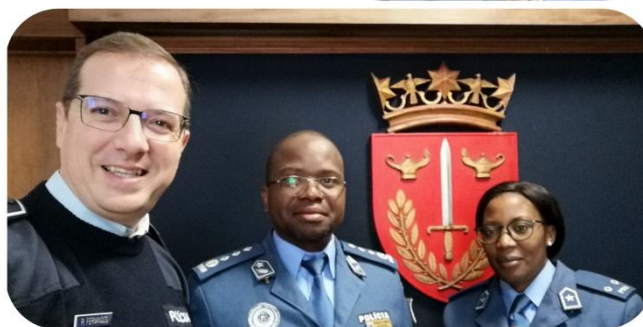
Ilustração 1 – Visita da Direção da Academia de Ciências Policiais (ACIPOL) de Moçambique ao ICPOL do ISCPSI, no último trimestre de 2019.