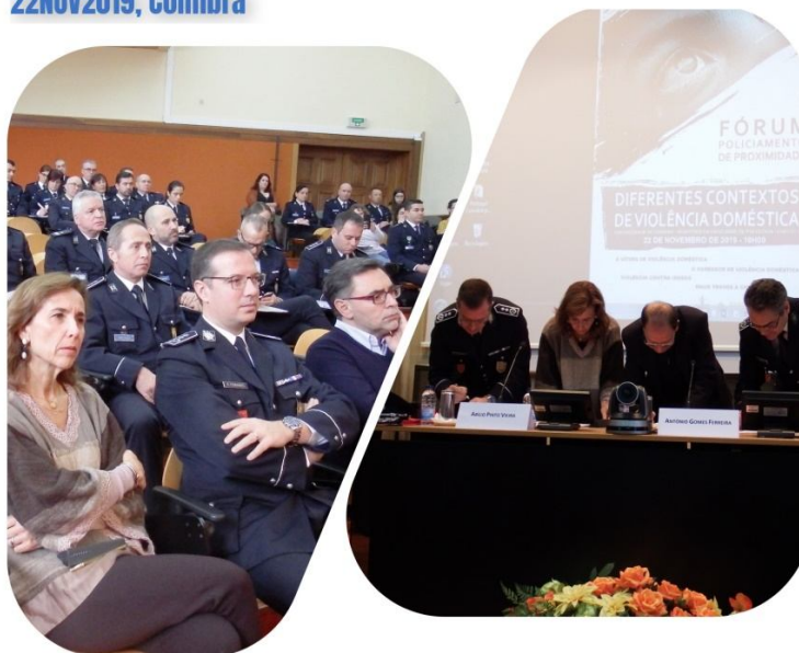
Ilustração 9 – Assinatura do Protocolo entre o ISCPPI e a Faculdade de Psicologia e Ciências da Educação, da Universidade de Coimbra.