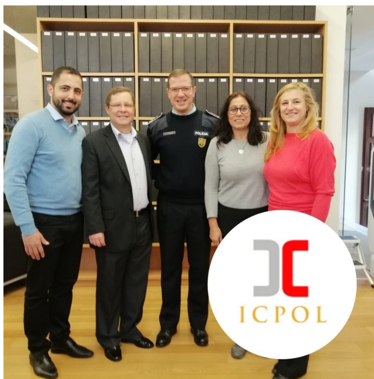
Ilustração 3 – Receção de comitiva brasileira, encabeçada pelo Juiz de Direito, Rodrigo Foureaux, do Tribunal de Justiça do Estado de Goiás, República Federativa do Brasil, ao ICPOL do ISCPSI, em 18 de novembro de 2019.

Por outro lado, o «movimento de dentro para fora» foi materializado com a realização de eventos científicos nacionais nas seguintes Universidades: Algarve, Évora, Porto, Minho, Coimbra, Beira Interior e nos Institutos Politécnicos de Castelo Branco e Viseu; e, igualmente, com expressão a nível internacional das Universidades de Salamanca, UNDE-Madrid, Brasília [UnB] e PUC-RS.