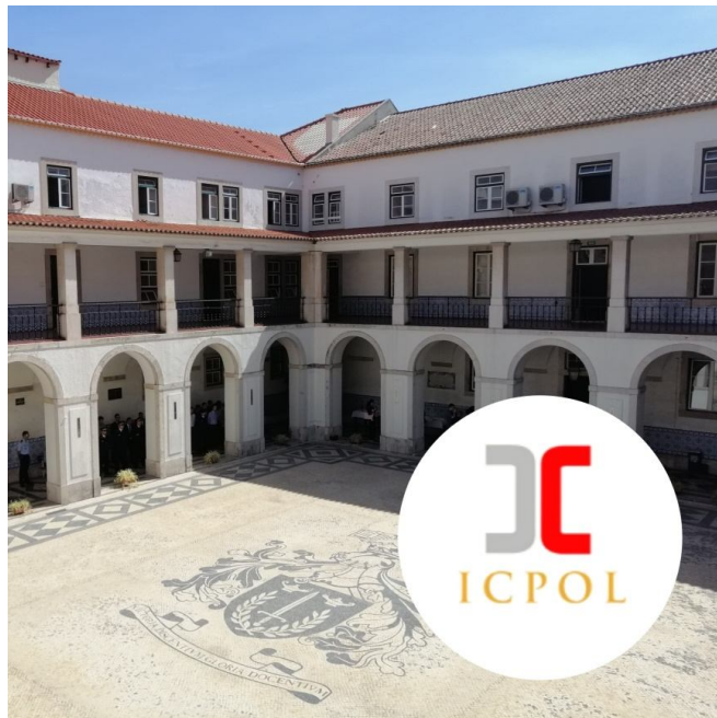
Ilustração 2 – Claustros e parada interior do ISCP.

Por fim, recorde-se ainda que a existência de unidades orgânicas de I&D nas instituições de ensino superior universitário é, também, uma exigência do Decreto-Lei nº 74/2006, de 24 de março – Regime jurídico dos graus académicos e diplomas do ensino superior (RJGADES) para que sejam avaliados e acreditados os ciclos de estudos conferentes dos graus académicos de Mestre e Doutor, conforme se retira das alíneas a) e c) do n.º 2 do Artigo 16.º, das alíneas a) e d) do n.º 2 do Artigo 29.º do RJGADES, conjugado com os Artigos 47.º e 50.º do RJIES.