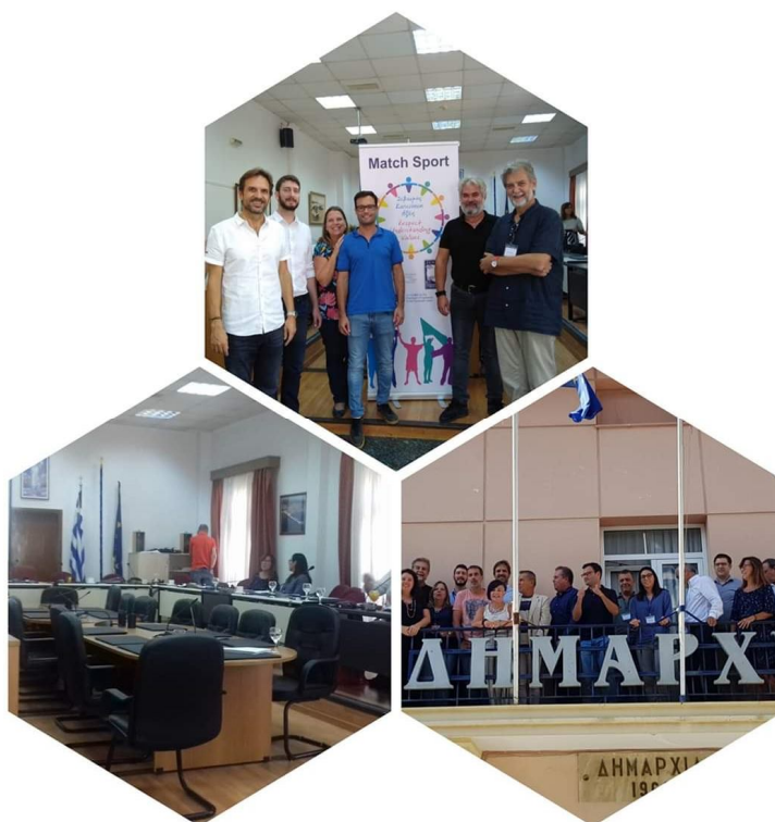
Ilustração 8 – Envolvimento do ICPOL/ISCPSI na reunião de coordenação do projeto Match-Sport , realizada na Grécia, em 30 de outubro de 2019.