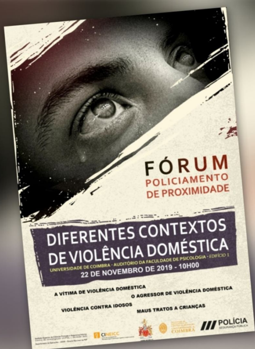
Ilustração 7 – Cartaz da edição 2019 do Fórum de Policiamento de Proximidade.

Sublinhamos ainda a estreita articulação com a Direção Nacional da PSP na organização e realização da edição anual do Fórum de Policiamento de Proximidade, subordinado ao tema «Os diferentes contextos de violência doméstica», que decorreu nas instalações da Faculdade de Psicologia e Ciências da Educação – Universidade de Coimbra, no passado dia 22 de novembro de 2019.