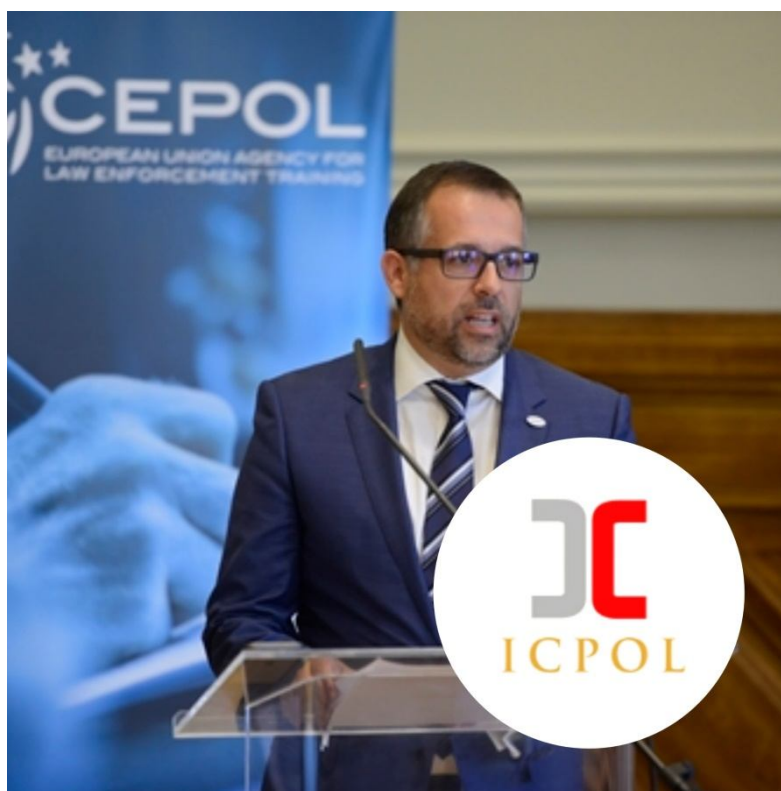
Ilustração 10 – A estreita articulação do ICPOL/ISCPsi com a CEPOL tem sido um dos expoentes da cooperação internacional, mormente no que toca à disseminação de produtos científicos.

A título meramente indicativo assinalamos as ligações institucionais estabelecidas com a Escola Ibero-Americana de Polícia (IBERPOL); com a Comunidade de Polícias da América (AMERIPOL); com a Associação Europeia dos Colégios de Polícia (AEPC); com a European Union Agency for Law Enforcement Training (CEPOL) e o CEPOL Knowledge Centre (CKC); com The International Association of Police Academies (INTERPA); com a Academia de Ciências Policiais de Moçambique (ACIPOL) e com outros centros de investigação de Países Africanos de Língua Oficial Portuguesa (PALOP), abrangidos pela nossa esfera de influência.