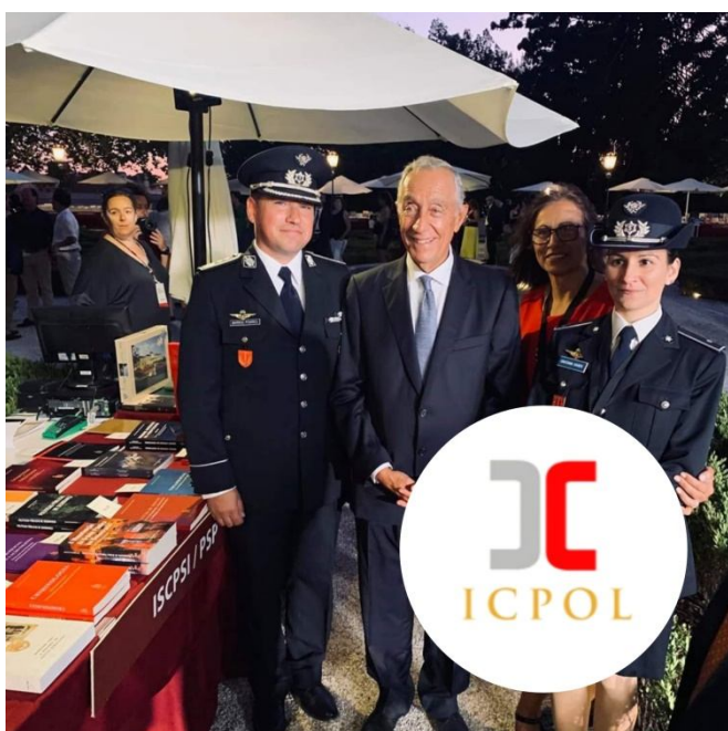
Ilustração 5 – Com o alto patrocínio do Presidente da República, a APEL organizou pela 4.ª vez, a Festa do Livro em Belém, que decorreu entre dias 29 de agosto a 01 de setembro de 2019, nos jardins do Palácio Nacional de Belém. O ICPOL/ISCPSP marcou presença no prestigiado evento.

A respeito da disseminação da marca ICPOL, o CDI representou o Instituto e a PSP na 89ª Feira do Livro de Lisboa, evento promocional da atividade e produção científica do Instituto/PSP, como acontecera anteriormente e com assinalável sucesso.