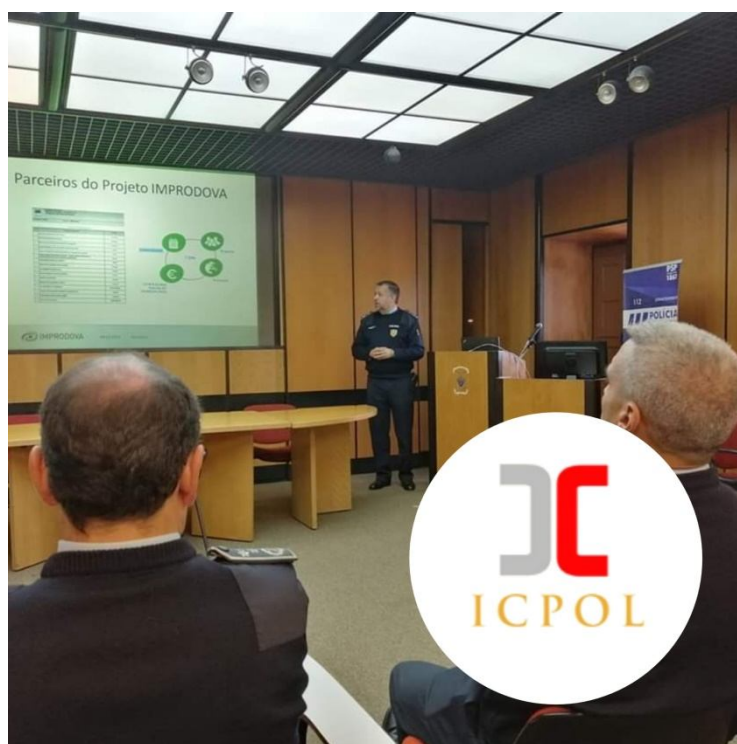
Ilustração 6 – Apresentação dos resultados preliminares do projeto IMPRODOVA pela equipa de investigadores do ICPOL à Direção Nacional da Polícia de Segurança Pública, em dezembro de 2019.